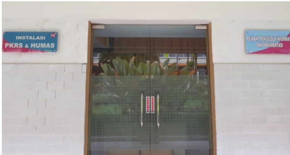
( Ruang PPID di Instalasi PKRS & Humas )

Dikarenakan luasnya area pelayanan, maka pengunjung yang membutuhkan informasi dapat dilayani di masing-masing unit kerja. Sedangkan untuk pemohon yang membutuhkan informasi publik lebih lanjut dapat diarahkan ke ruang PPID RSUD Dr. Soetomo yang berada di Instalasi PKRS dan Humas.