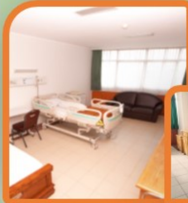
VVIP A Tarif Rp. 1.350.000/hari

Graha Amerta merupakan bagian dari RSUD Dr. Soetomo yang memberikan pelayanan privat baik rawat inap maupun rawat jalan. Graha Amerta memiliki kelas kamar yang terdiri dari President Suite, Premium Suite, VVIP A, VVIP B dan VIP. Graha Amerta juga menghadirkan kepada pasien klinik dokter spesialis dan subspecialis. Kualitas pelayanan dan fasilitas yang ada ditunjang dengan kelengkapan lainnya, seperti klinik fertilitas, farmasi 24 jam, klinik tumbuh kembang anak dan laboratorium 24 jam. Untuk pelayanan khusus pasien bedah (rawat jalan, inap dan kamar operasi) berada di STOC (Soetomo Transplant Organ Center) Graha Amerta dengan nuansa gedung baru. Graha Amerta dan gedung STOC telah ditetapkan sebagai zona non covid-19 dengan tetap menerapkan skrining dan adaptasi kebiasaan baru di rumah sakit.