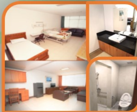
PREMIUM SUITE Tarif Rp. 1.800.000/hari