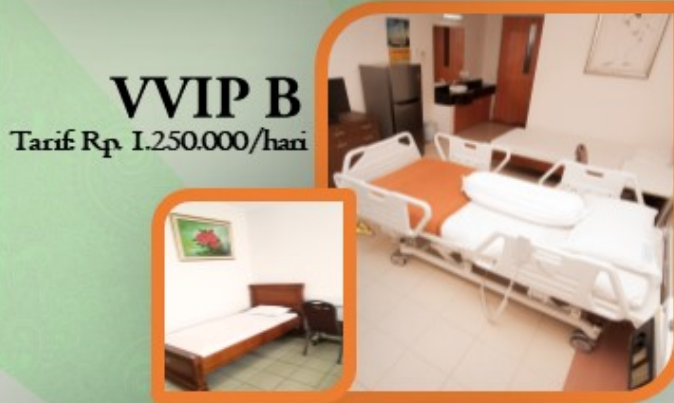
VVIP B Tarif Rp. 1.250.000/hari