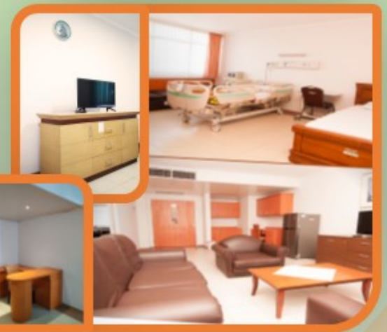
PRESIDENT SUITE Tarif Rp. 2.000.000/hari